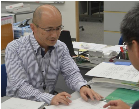
東松山市商工会 職員 平成4年入職