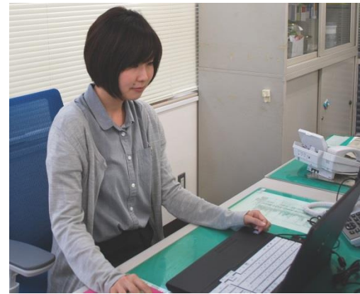
蓮田市商工会 職員 平成27年入職

商工会はとても明るく、働きやすい職場です。そして、自分の頑張りでも地域を元気にすることができます。私たちと一緒に、地域を元気にしていきましょう！