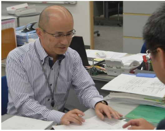
東松山市商工会 職員 平成4年入職