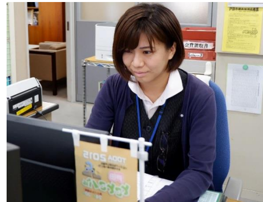
戸田市商工会 職員 平成27年入職

商工会は自分の頑張りや地域への発展に貢献でき、変化を目の当たりにできる仕事です。私たちと一緒に、地域を元気にしていきましょう！