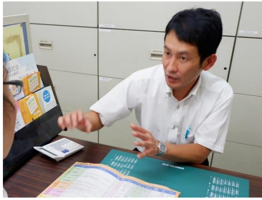
鳩ヶ谷商工会 職員 平成9年入職